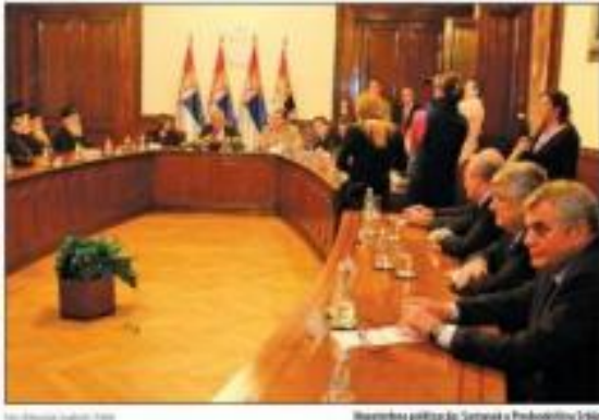
Službeno posredništvo: Sastanak u Predsjedništvu Srbije