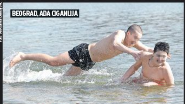
BEOGRAD, ADA CIGANLIJA

ISTRAŽUJEMO: KAKO JE KINA SAVLADALA VIRUS KORONA