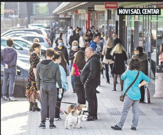
NOVI SAD, CENTAR