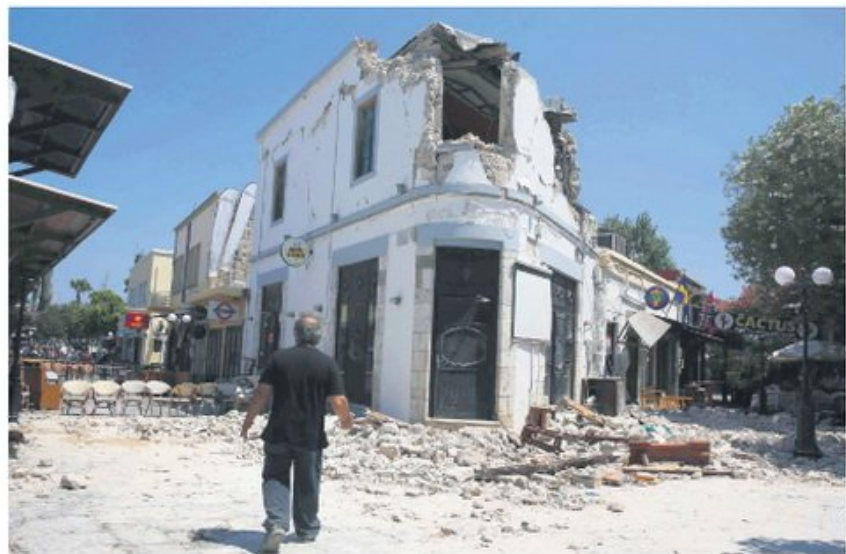
Последице потреса видљиве су на сваком кораку: острво Кос