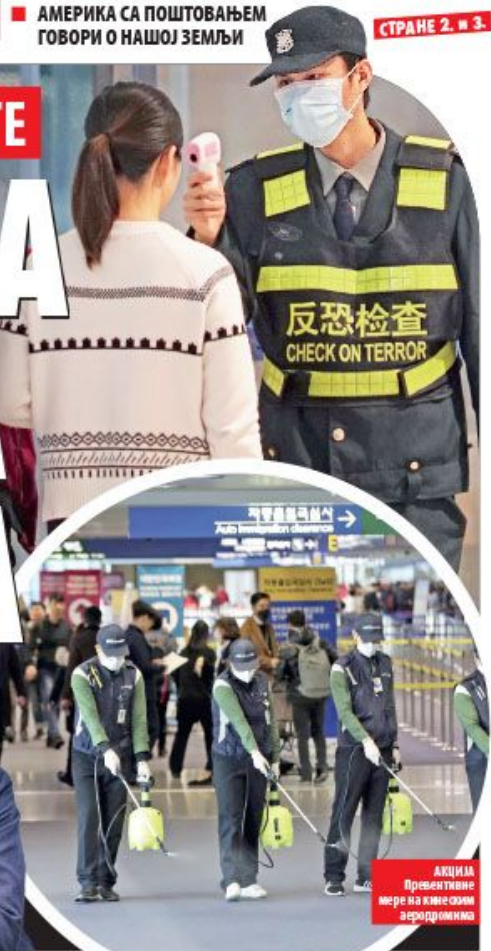
АКЦИЈА Превентивне мере на кинеским аеродромима