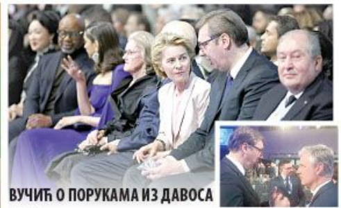
ВУЧИЋ О ПОРУКАМА ИЗ ДАВОСА

ИЗДАЊЕ ЗА СРЕДНУ вечерње НОВОСТИ ISSN 0358-6999 СРЕДА 22. јануар 2020. Цена 45 динара Београд • Година LXVII • www.novosti.rs ДНЕВНИ ЛИСТ С НАЈВЕЋИМ ТИРАЖОМ