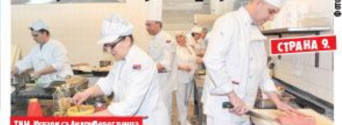
ТММ Чувари са Андрићевог венца

"НОВОСТИ" У КУХИЊИ И ПРЕДСЕДНИШТВА СРБИЈЕ Вучићу уштипци Путину крушке