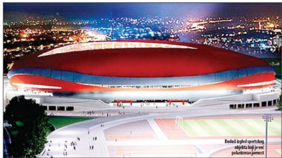
Budući izgled sportskog objekta koji je već polarizovao javnost

■ U dokumentu koji popisuje kapitalne projekte u naredne tri godine (2020-2022) i novac potreban za njihovo ostvarenje, nigde se ne pominje stadion