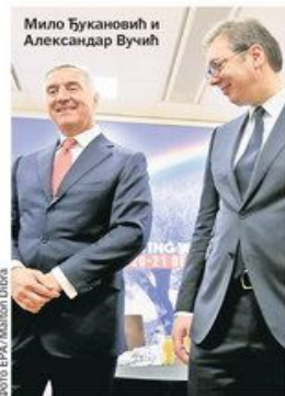
Мило Ђукановић и Александар Вучић