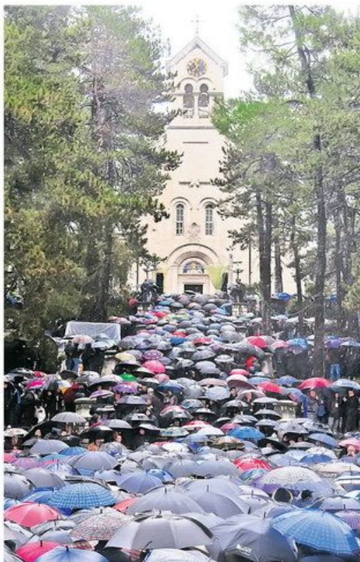
Скуп у Саборном храму Светог Василија Острошког протекао је без инцидената, а упркос киши и ветру, окупио је 20.000 верника из целе Црне Горе