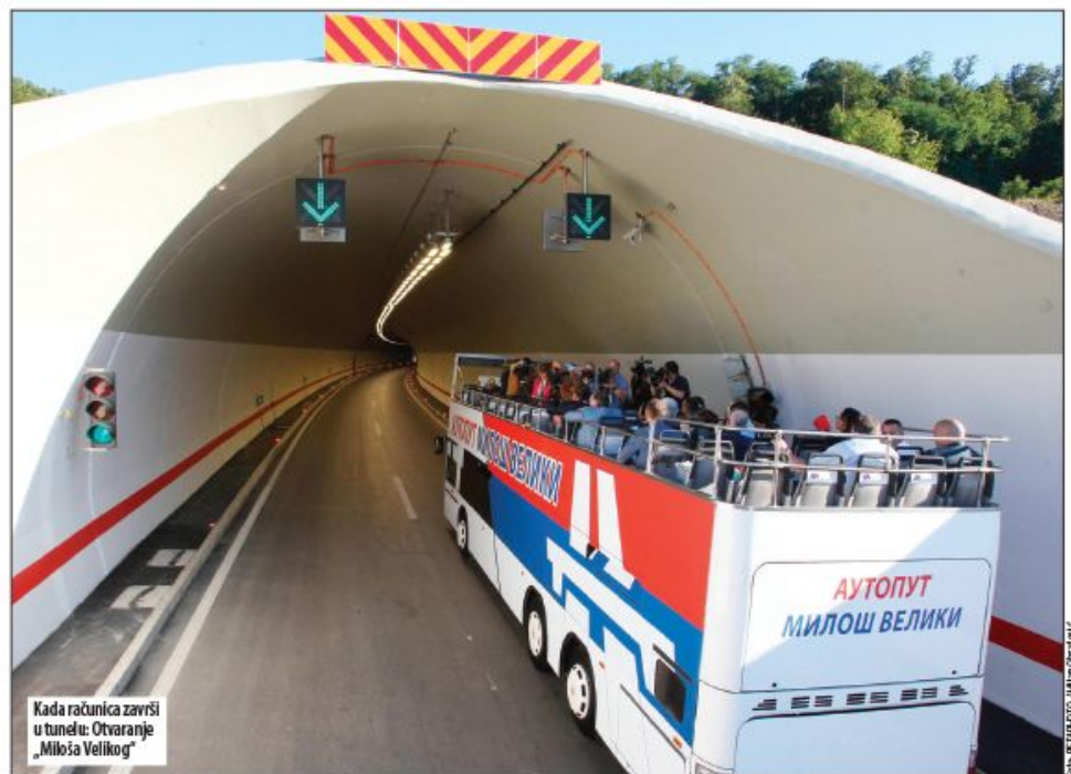
Kada računica završi u tunelu: Otvoranje „Miloša Velikog“