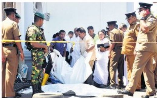
Полиција и спасиоци износе жртве из цркве у Коломбу