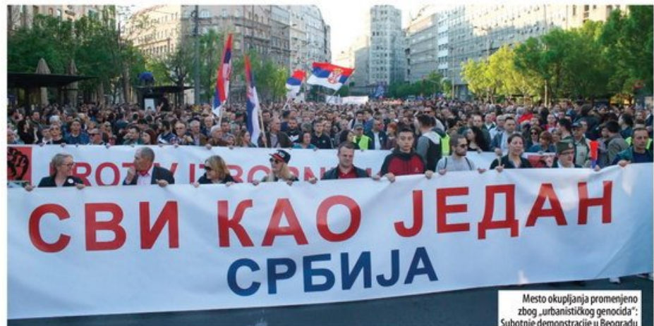
Mesto okupljanja promenjeno zbog „urbanističkog genocida“: Subotnje demonstracije u Beogradu