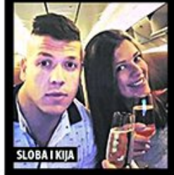
SLOBA I KIJA