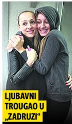
LJUBAVNI TROUGAO U „ZADRUZI“