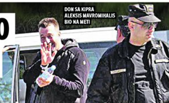
DON SA KIPRA ALEKSIS MAVROMIHALIS BIO NA METI