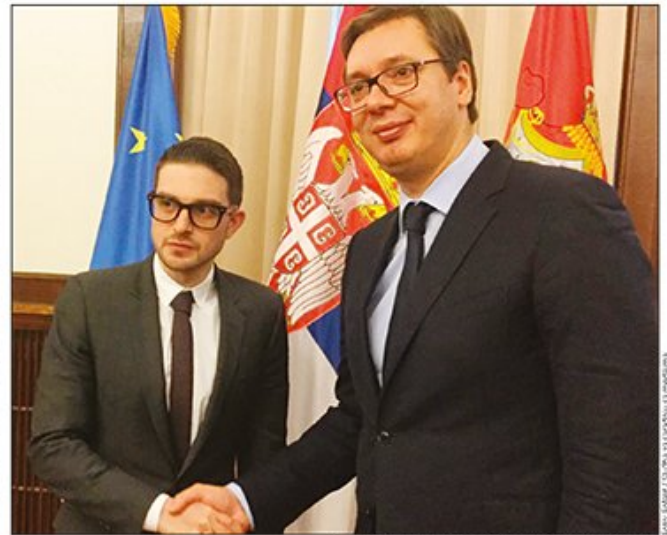
Drugi susret za mesec dana: Aleks Soros i Aleksandar Vučić