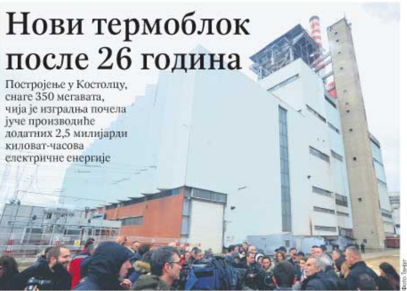
Новинари испред постојећег блока Термоелектране „Костолац“ у Дрину, поред којег ће се градити ново постројење

Постројење у Костолацу, снаге 350 мегавата, чија је изградња почела јуче производиће додатних 2,5 милијарди киловат-часова електричне енергије