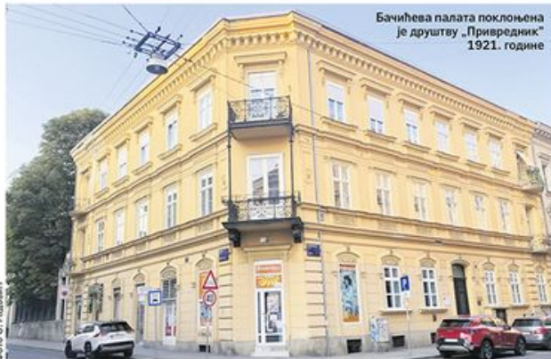
Бачићева палата поклонила је друштву „Привредник“ 1921. године