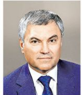
Вјачеслав Володин, председник Думе