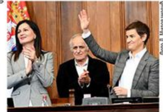
Фото А. Милошевић