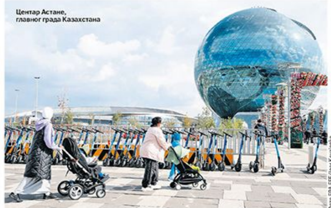
Центар Астане, главног града Казахстана