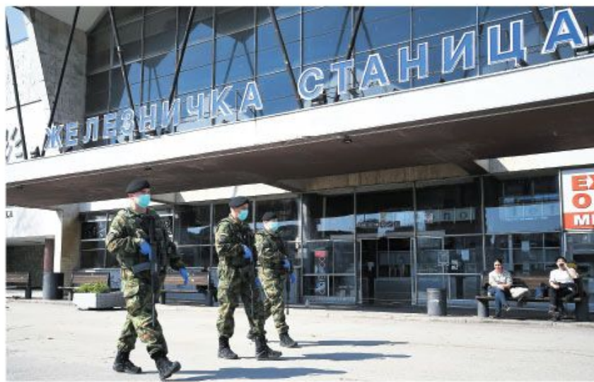
Нови Сад: јуче у подне потпуно је обустављен међуградски саобраћај у целој Србији