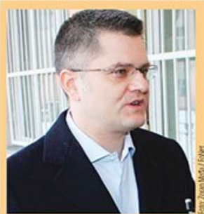
Lider Narodne stranke o napadu na šefa izbornog štaba te partije u Smederevskoj Palanci