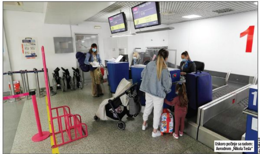
Uskoro počinje sa radom: Aerodrom „Nikola Tesla“

■ Milan Kovačević , konsultant za investicije: Da su dve kompanije (Aerodrom i Vansi) potpisale ugovor, dobro bismo stajali. Ovakvo pozivanje na višu silu pada u vodu, jer je Vlada zabranila rad aerodroma