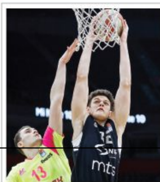
Crno-belima FIBA Liga šampiona trenutno uopšte nije prioritet

Za policiju nije isto kad protestuju SNS i radnici PKB Strana 11