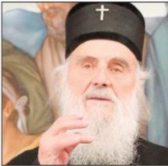
Patrijarh SPC Irinej za Danas

Obradović uvek radi šta hoće i na svoju ruku Strana 3