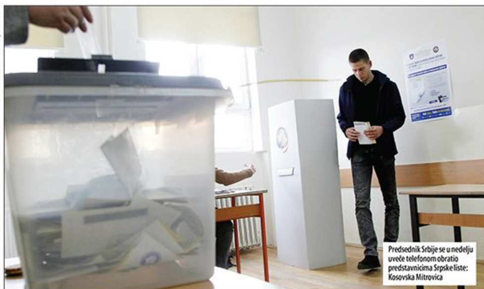
Predsednik Srbije se u nedelju uveče telefonom obratio predstavnicima Srpske liste: Kosovska Mitrovica