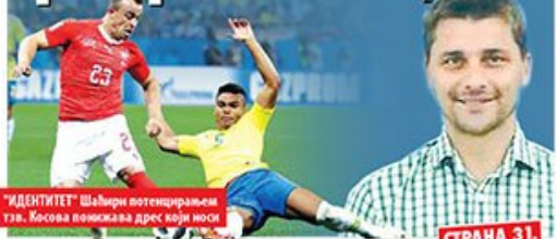
"ИДЕНТИТЕТ" Шаћери потенцијалем тзв. Косова помича дрес који носи