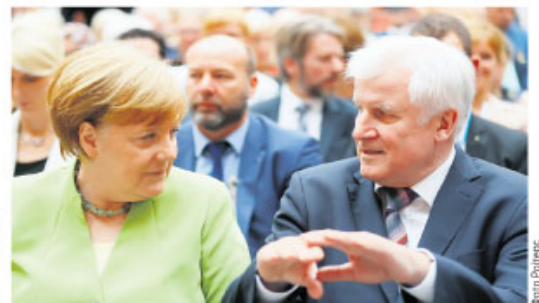
Ангела Меркел и Хорст Зехофер

Канцеларкина политика „отворених врата“ довела је до тога да је до- била рок од две недеље да на самиту ЕУ крајем месеца обезбеди решење. Не верује се, међутим, да ће у супрот- ном њен кабинет пасти, као што нема много вере ни да ће лидери у Бриселу бити у стању да мигрантско кретање