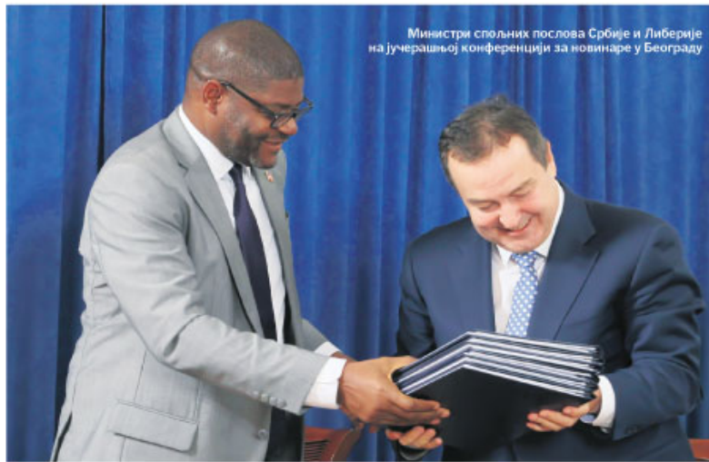
Министри спољних послова Србије и Либерерије на јучерашњој конференцији за новинаре у Београду