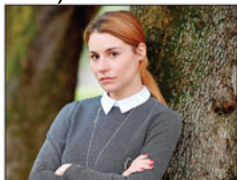
Tihana Lazović, hrvatska glumica