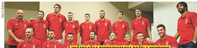
KOŠARKAŠKA REPREZENTACIJA POČELA PRIPREME