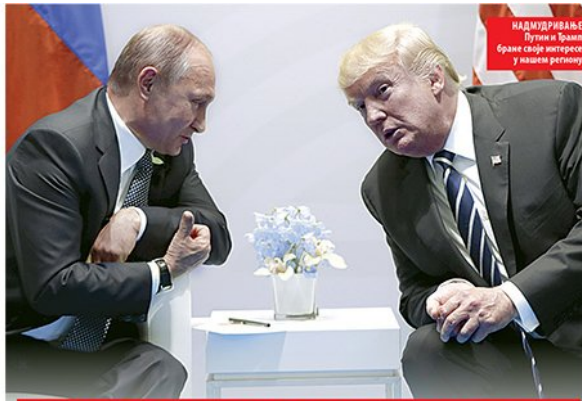
НАДМОРНИЦИ Путин и Трамп Бране своје интересе у нашеј региону

ЖАЛБА ЈЕДНОГ ПОНУЂАЧА СТОПИРАЛА ТЕНДЕР Заустављена набавка вакцина против грипа СТРАНА 4.