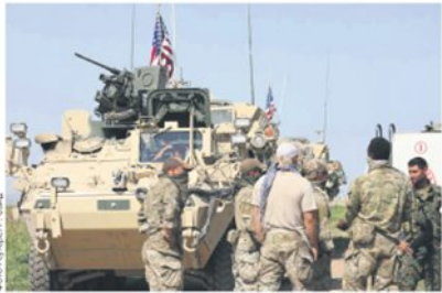
Пуштање поверљивих података у јавност уследило за споразумом о куповини система С-400 од Русије за 2,5 милијарди долара