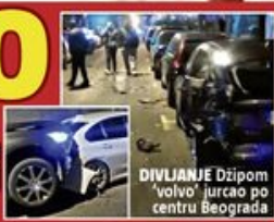
DIVLIJANJE Džipom 'volvo' jurcao po centru Beograda