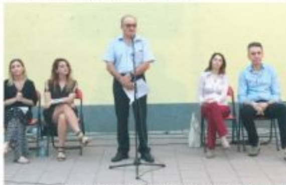
Samo dve opozicione stranke učestvuju na izborima: Sa tribine EUO u Majdanpeku