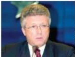
Wolfgang Petrič, bivši specijalni izaslanik EU za Kosovo