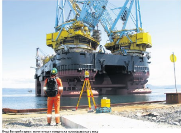
Куда ће проћи цевик: политичка и геодетска премеравања у току

Тиме овај лист хоће да каже да „Гаспром“ заправо има план „Б“ у случају да Бугарска настави са ометањем изградње гасовода „Јужни ток“. Како се наводи, руски председник Владимир Путин је већ изјавио да ће Анара омогућити да „Јужни ток“ иде до Турске испод Црног мора, на шта је његов руски колега Александар Новак одговорио да технички таква могућност постоји, али да таквих предлога из „Европада“ још није било. С друге стране, руски извори кажу