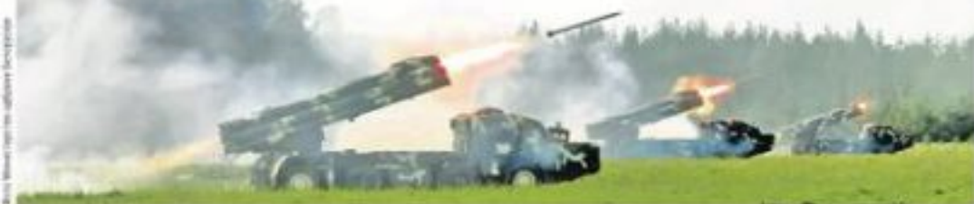
Руске и белоруске војне јединице на војничкој вежби

Уместо 100.000 војника, због којих се на Западу дигла паника, на руско-белоруски маневрима је само 12.700 људи, док ће на истоку Европе ове године у вежбама учествовати укупно 60.000 војника НАТО-а.