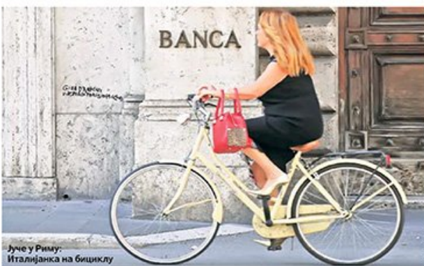
Јуче у Риму. Италијанка на бициклу

Европска унија дала Италији рок до понедељка да објасни шта планира са дефицитом и дугом од 2.300 милијарди евра. – Мање од половине Италијана гласало би за останак у ЕУ