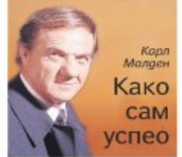
Карл Малден Како сам успео