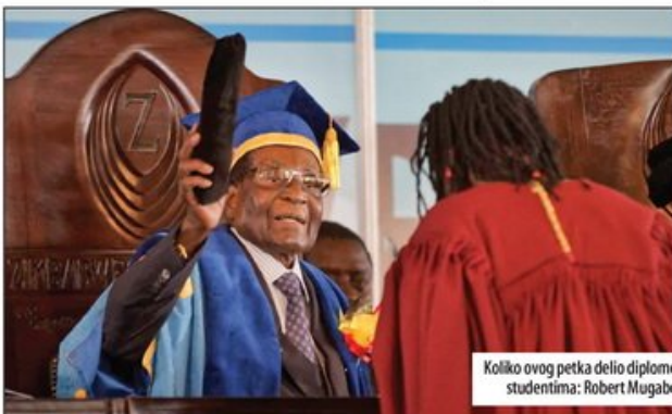
Koliko ovog petka delio diplome studentima: Robert Mugabe

Susreti novinara Danasa sa predsednikom Zimbabvea