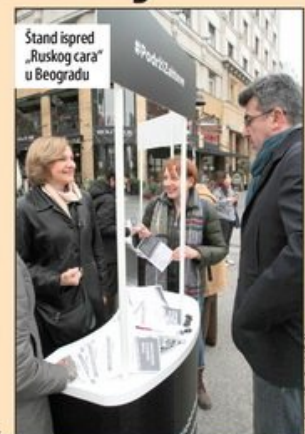
Stand ispred „Ruskog cara“ u Beogradu