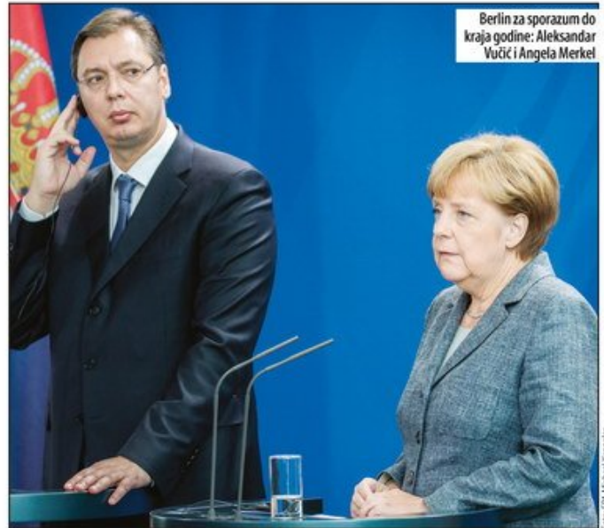
Berlin za sporazum do kraja godine: Aleksandar Vučić i Angela Merkel

Da li su građani razmaženi ili neće da stvaraju nove siromahe