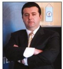
Autorski tekst Orhana Dragaša povodom izbora u Rusiji

Nastavlja se brak Putina i obaveštajnih službi