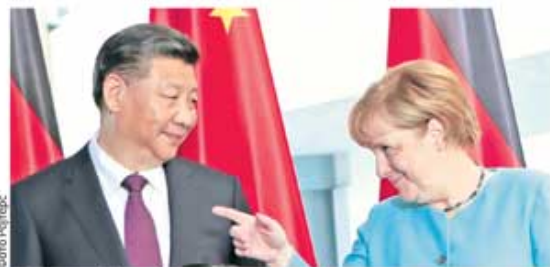
Си Ђинпинг и Ангела Меркел

Ангела Меркел и Си Ђинпинг гурнули на страну међусобне привредне спорове и траже преговоре о прекомерној производњи челика. – О тарифама на челик треба разговарати унутар Г20, чiji је самит почео јуче, поручио кабинет канцеларке