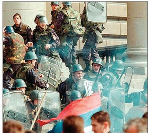
Ista koalicija je bila na vlasti i 2000. godine: Ispred Skupštine 5. oktobra

Sastanak ministara Nedimovića i Ljajića sa predstavnicima Asocijacije malinara Srbije