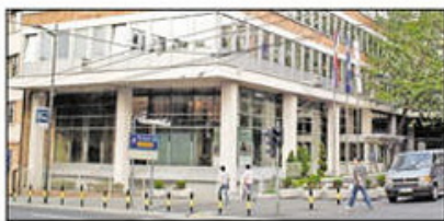
Opoziciji zabranjeno da se pojavljuje na javnom servisu