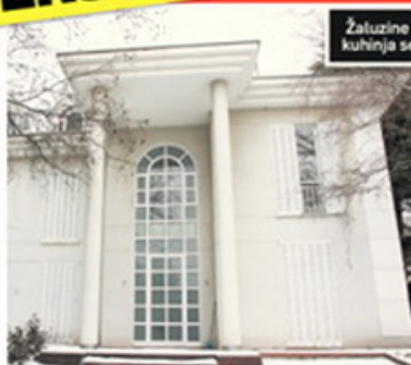
Žaluzine ne rade, kuhinja se raspala