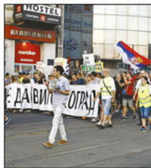
Aktivisti Inicijative „Ne da(vi)m Beograd“ dali izjave u Prekršajnom sudu