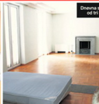
Dnevna soba i jedno od tri kupatla