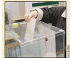
Spekulacije o datumu predsedničkih izbora