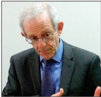
Profesor na američkom Univerzitetu Džons Hopkins i stručnjak za Balkan