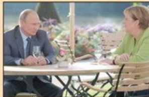
Energetika centralna tema susreta nemačke kancelarke i ruskog predsednika u dvorcu Mezenberg