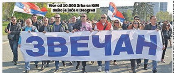
Više od 10.000 Srba sa Kim došlo je juče u Beograd