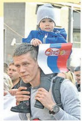
150.000 ljudi okupilo se ispred Skupštine da podrži politiku predsednika Aleksandra Vučića