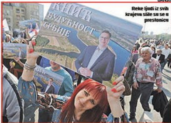
Reke ljudi iz svih krajeva stale su se u prestonicu