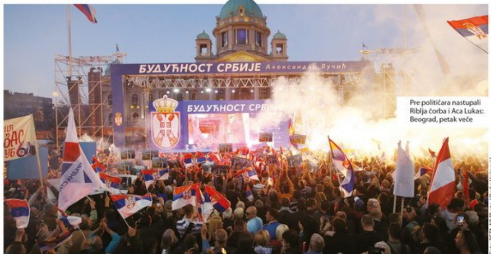
Pre političara nastupali Ribija Ćorba i Aca Lukas: Beograd, petak veče