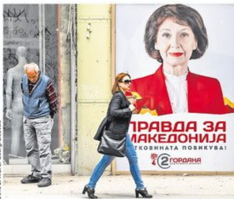
Право гласа на сутрашњим изборима има око 1,8 милиона бирача