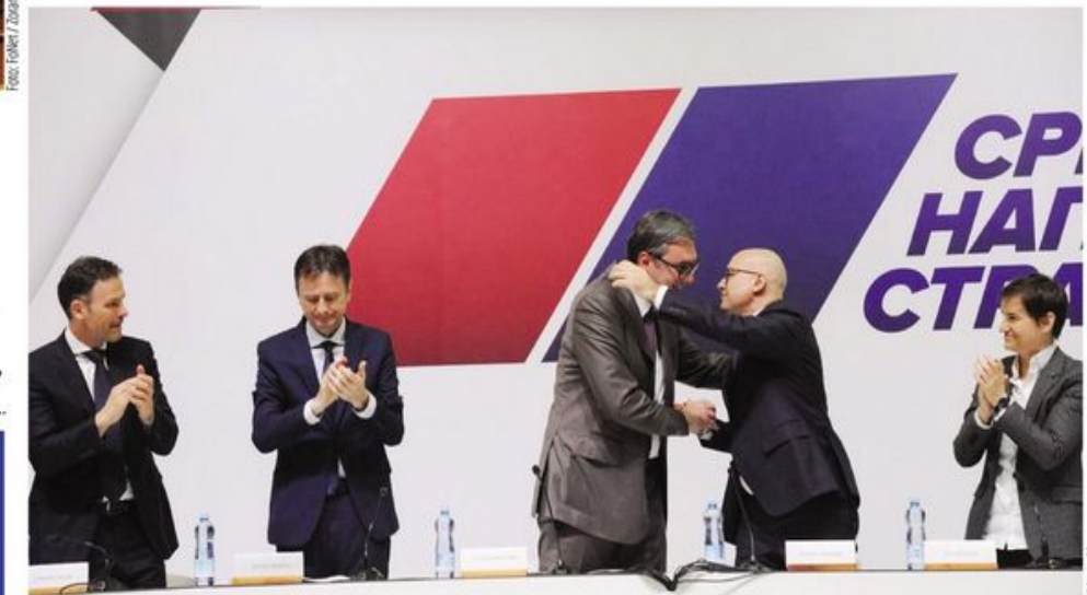
Predaja vlasti rukovanjem: Sa Skupštine SNS u Kragujevcu

Novi policijsko-sindikalni savez uputio otvoreno pismo predsedniku Srbije