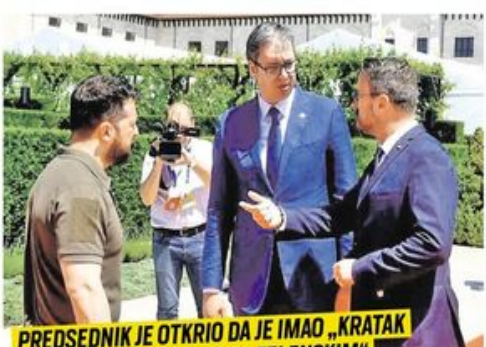
PRESEDNIK JE OTKRIO DA JE IMAO „KRATAK I DOBAR RAZGOVOR SA ZELENSKIM“