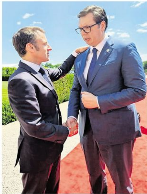
Емануел Макрон и Александар Вучић јуче у Кишињеву