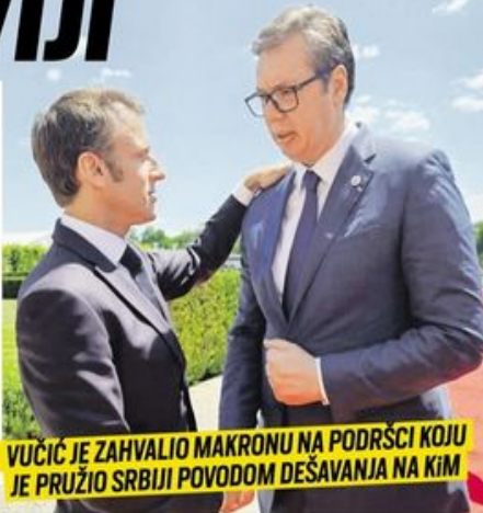
VUČIĆ JE ZAHVALIO MAKRONU NA PODRŠCI KOJU JE PRUŽIO SRBIJI POVODOM DEŠAVANJA NA KIM