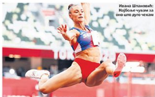
Ивана Шпановић: Најбоље чувам за оно што дуго чекам