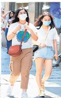
Врђуина се тешко подноси под маском