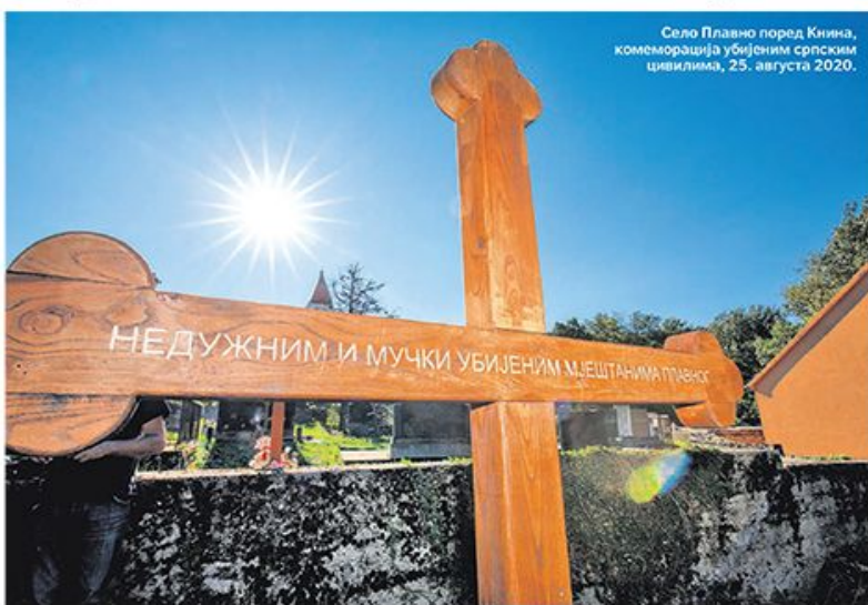
Село Плавно поред Книна, комејорација убијеним српским цивилцима, 25. августа 2020.

Специјално за „Политику“ Оливера Радовић