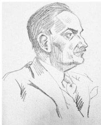
Немачки генерал Александар Лера, који је припремио и спровео бомбардовање Београда 6. априла 1941.

Из фонда Музеја жртва геноцида, „Политика“ ексклузивно објављује портрете немачких официра осуђених у Београду 1947, које је нацртао уметник чији је ликовни израз деценијама био заштитни знак нашег листа