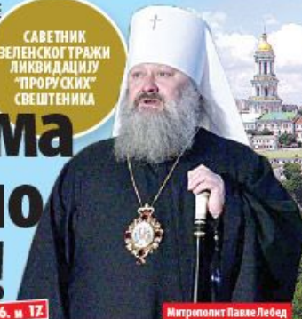
Митрополит Павле Лебед

САВЕТНИК ЗЕЛЕНКОГ ТРАЖИ ЛИКВИДАЦИЈУ "ПРОУСКИХ" СВЕШТЕНИКА