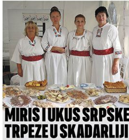
MIRIS I UKUS SRPSKE TRPEZE U SKADARLIJI