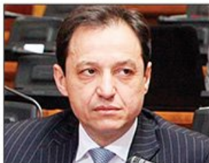
NAŠA PRIČA: Kakva će biti nova opoziciona organizacija na političkoj sceni Srbije