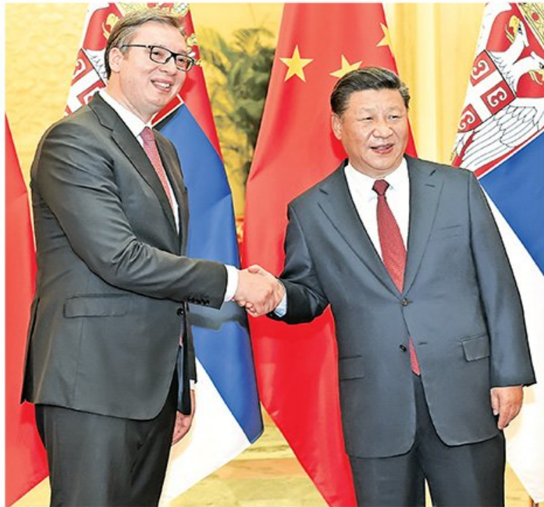
Александар Вучић и Си Ђинпинг јуче у Пекингу

Током посете делегације Србије Кини потписано је 11 споразума, вредних три милијарда долара. Значај кинеских инвестиција, појаснио је јуче Вучић, најбоље разумеју запослени у смедеревској Железари,