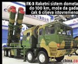
FK-3 Raketni sistem dometa do 100 km, može da gađa čak 6 ciljeva istovremeno

Kineski predsednik juče izjavio da će apsolutno svim sredstvima, pa i vojnim, pomoći Srbiji da sačuva teritorijalni integritet i suverenitet