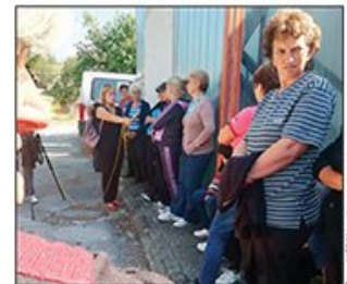
Drugi dan protesta radnika Gumpoplastike bez reakcije Vlade Srbije