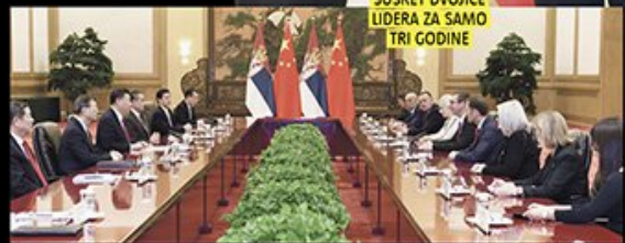
SUSRET DVOJICE LIDERA ZA SAMO TRI GODINE

Kineski predsednik juče izjavio da će apsolutno svim sredstvima, pa i vojnim, pomoći Srbiji da sačuva teritorijalni integritet i suverenitet