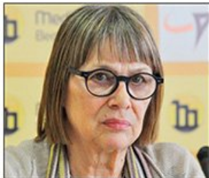
Osnivačica Fonda za humanitarno pravo povodom penzionisanja i odlikovanja načelnika Generalštaba VS