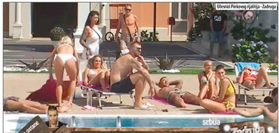
Učesnici Pinkovog rijalitija - Zadruga

■ Željko Mitrović: Vukosavljević je površna nezalica i inkvizitor ■ Olivera Zekić: Ministar je pobrkao lončiče ■ Vladan Vukosavljević: Ako me Mitrović zbog stavova koje iznosim smatra „inkvizitorom“ neukusa, duhovne bede i prostakluka, onda to shvatam i kao neku vrstu komplimenta