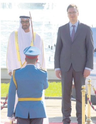
„Београд на води” мења ими Србије

Када је о пензијама реч, заштитили смо много више људи, односно 60,2 одсто њих, доадо је он. На остале пензије примењиваће се прогресивна стопа умањења, па ће они који више и зарађују више и платити. страна 5