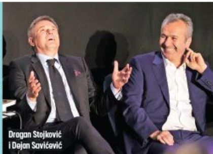
Dragan Stojković i Dejan Savičević