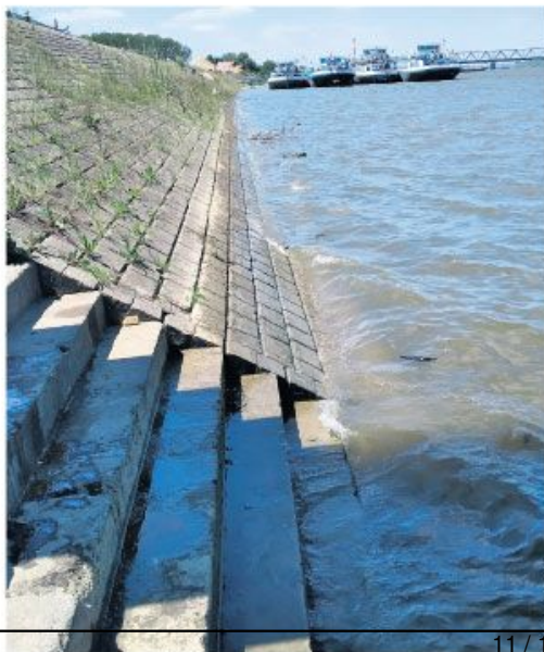
Место где је пронађено тело