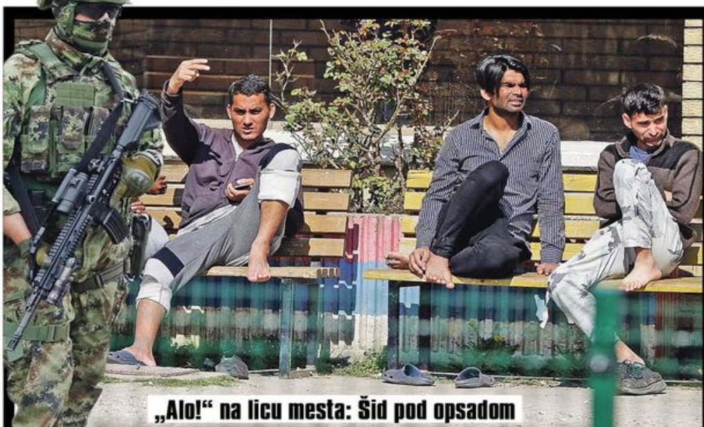
„Alo!“ na licu mesta: Šid pod opsadom