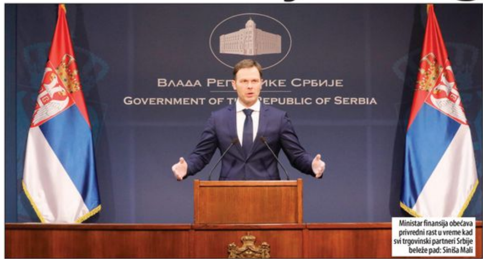
Ministar finansija obećava privredni rast u vreme kad svi trgovinski partneri Srbije beleže pad: Siniša Mali