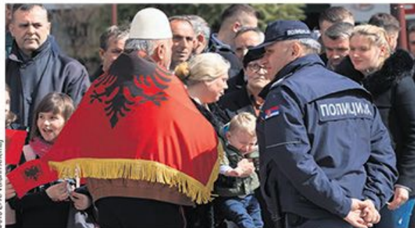
На улицама Бујановца пред посету председника Албаније 2017. године