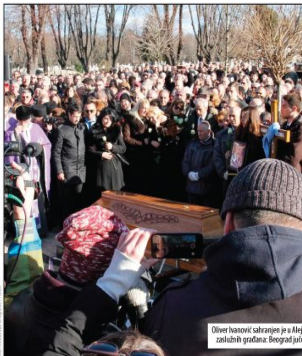
Oliver Ivanović sahranjen je u Aleji zaslužnih građana: Beograd juče

Ruben Estlund, švedski reditelj, dobitnik Zlatne palme i gost Kustendorfa, govori za Danas