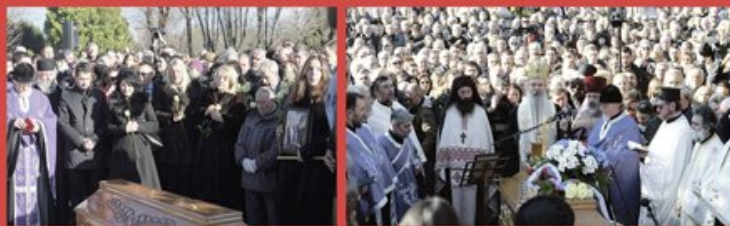
UBIJENI LIDER SDP SAHRANJEN JUČE U ALEJI ZASLUŽNIH GRADANA NA BEOGRADSKOM NOVOM GROBLJU