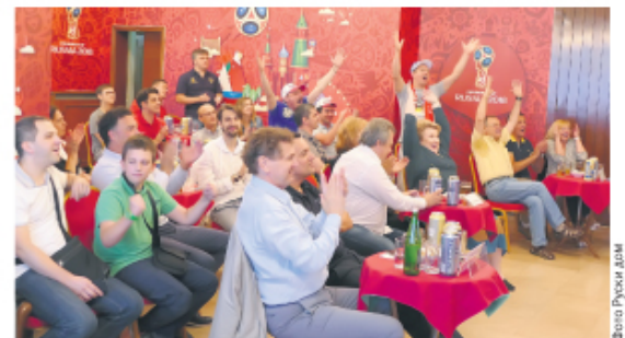
Навијање током квалификација за Светско првенство