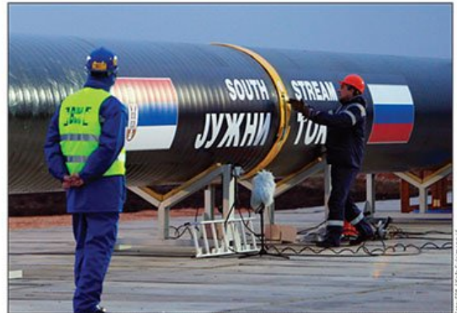
Moguća izgradnja tranzitnog gasovoda ka zemljama EU: Sa početka radova na Južnom toku 2013.