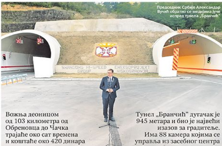
Председник Србије Александар Вучић обратио се медијима јуче испред тунела „Бранчић“

Вожња деоницом од 103 километра од Обреновца до Чачка трајаће око сат времена и коштаће око 420 динара