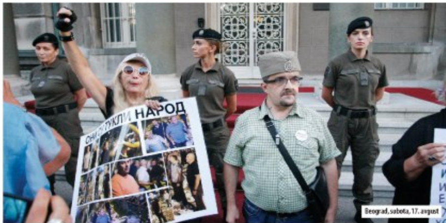
Beograd, subota, 17. avgust

Gradani su uzvikivali „čuvajte se Jutke“, „uhapsite Vučića“ i „Oliver Ivanović“, pripadnice Kobri stajale su mirno, bez ikakve reakcije i bez promene izraza lica ■ Gotovo da nema učesnika protesta koji ih nije fotografisao telefonom, a bilo je i onih koji su im poručivali „da idu na Kosovo, u Mitrovicu“ ■ U blizini stajali policajci u civilu