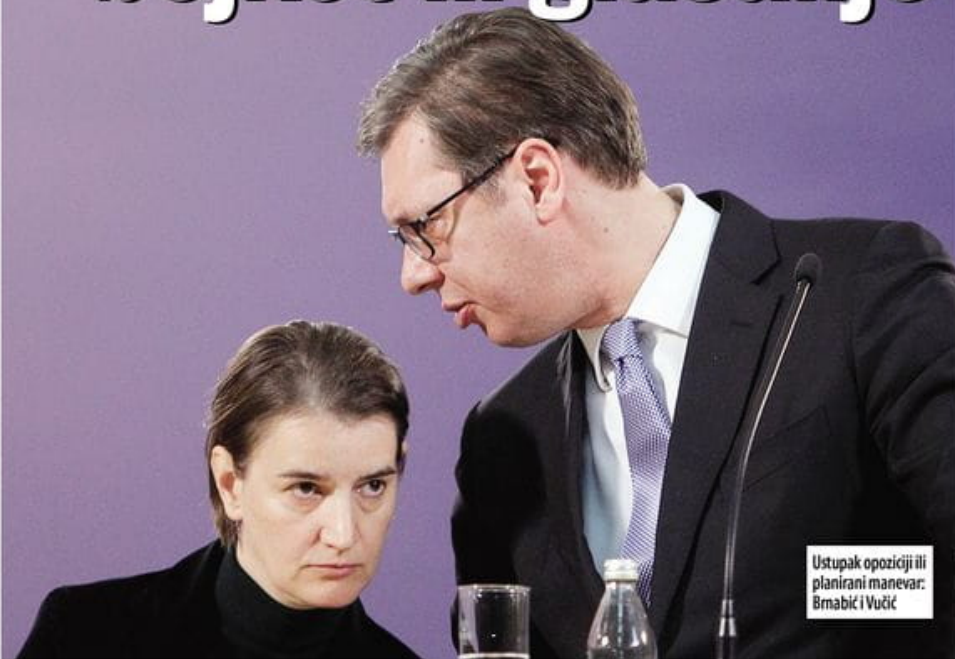
Ustupak opoziciji ili planirani manevar: Brnabić i Vučić