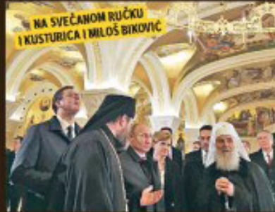
Predsednici postavili deo mozaika u Hramu Sv. Save