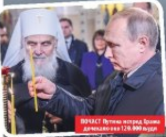
ПОЧАСТ Путин изјавио, Београд дочекано око 12.000 људи