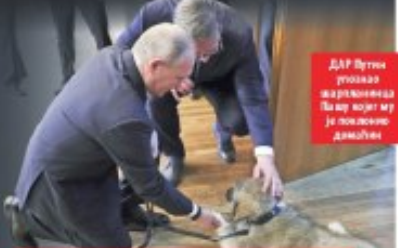
ДАР Путин уочио заједнички Парис који му је поздравно дошао

ВУЧИЋ: БЕЗ УЧЕШЋА МОСКВЕ НЕЋЕ НИ БИТИ ДОГОВОРА, НЕ ПРИСТАЈЕМО НА ПОНИЖЕЊЕ