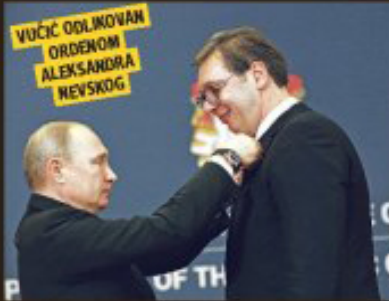
Putin obećao pomoć oko Kosova, šta će reći EU?