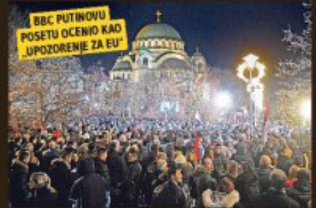
Putina pozdravilo 120.000 ljudi