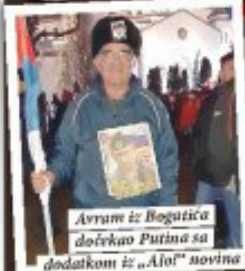
Avrum iz Bogutica dočeka Putina sa dodatkom iz „Alo!” novine