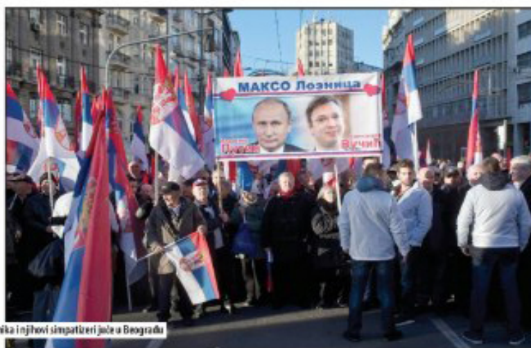
Два председника и њихови симпатизери јале у Београду