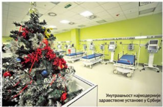
Унутрашњост најмодерније здравствене установе у Србији

ђеном и од темеља реконструисаном старом објекту, који је почео да се гради још пре скоро четири деценије, али никада није завршен. страница 5