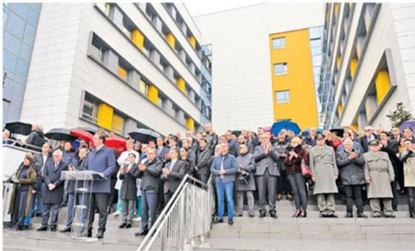
Државни врх Србије испред новог Клиничког центра у Нишу

Ниш – У присуству највишег државног врха Србије, представника Нишавског и свих околних југ и југоисточних крајева, јуче је свечано отворен и предат на коришћење нови Клинички центар Ниш, први од четири који у наредних неколико година треба да буду завршени. Свечаности у Нишу присуствовали су председник Србије Александар Вучић и председница Владе Ана