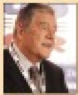
Milorad Dodik, član Predsedništva BiH, govori na konferenciji

DOBRINJ DANA: Kinovski premijer Li Kečjang podržao evropske integracije Srbije