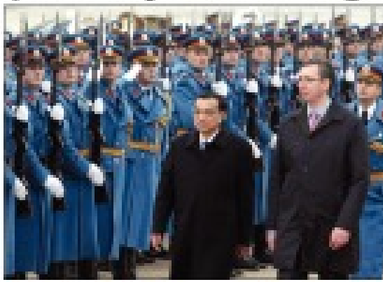
Li Keqiang i Milorad Dodik u Beogradu.

PRAVO Odbacuju kritičke prijedloge protiv Anđelke Malović i Neke Mijatović Tužiocu reforma sudstva nije sumnjiva Prijava nije uzela u obzir ni za jednog člana prvog sastava VSS ■ U situaciji u kojoj je optuženo 1,5 milijardi dinara na ime odbijenih materijalnih zahtjeva razgovor je da tužilac nije primio te informacije, izdale godišnjici prijave