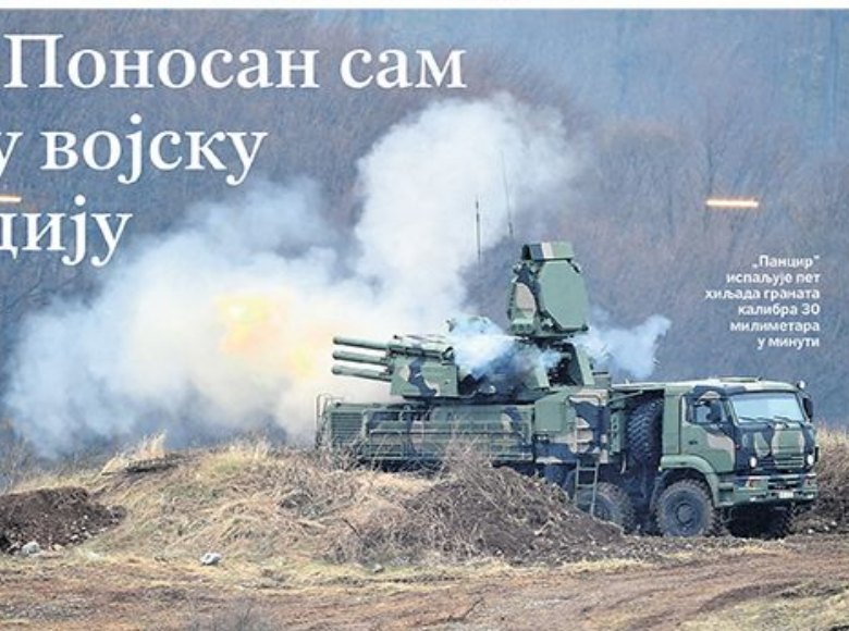
„Панцир” испалађује пет хиљада граната калибра 30 милиметара у минути

Видели смо како заједнички могу да раде Министарство одбране и Министарство унутрашњих послова, наша војска и наша полиција. Тим речима, председник Србије Александар Вучић оценио је учинак јучерашње здружене тактичко-показне вежбе са бојевим гађањем „Одговор 2021”. На њој је демонстрирано заједничко дејство око 1.200 припадника Војске Србије и 300 полицајаца на полигонима „Орешац” и „Пасуљанске ливаде”. Осим Вучића, вежби су присуствовали и други највиши званичници и представници државног и војног врха, а председник Србије је истакао да је веома поносан на оно што је приказано. Уз оцену