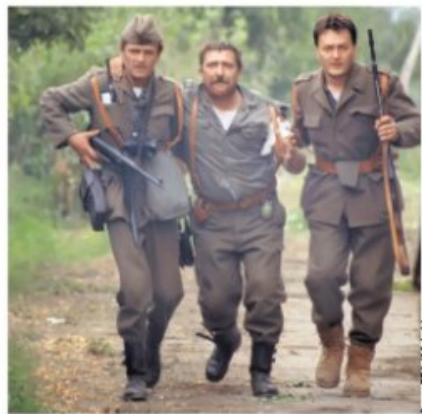
Припадници ЈНА на ратништу у Хрватској 1991.

Одбијен захтев Министарства за борачка и социјална питања за исплату више од 270.000 динара са затезном каматом