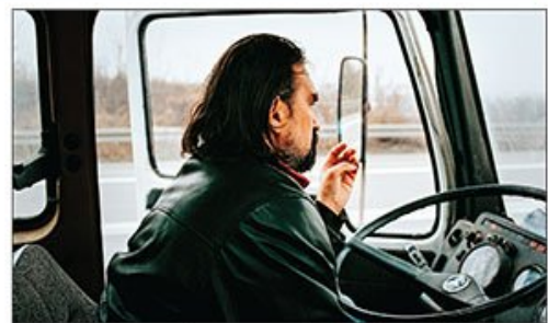
U Kanu film „Teret“ Ognjena Glavonića, o vozaču hladnjače sa leševima Albanaca