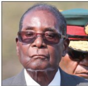
Zimbabve nakon navodnog vojnog puča