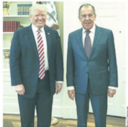
Председник САД тврди да је имао апсолутно право да Сергеју Лаврову саопшти поверљиве информације о Исламској држави и да се руководио жељом да Русија појача борбу против тероризма