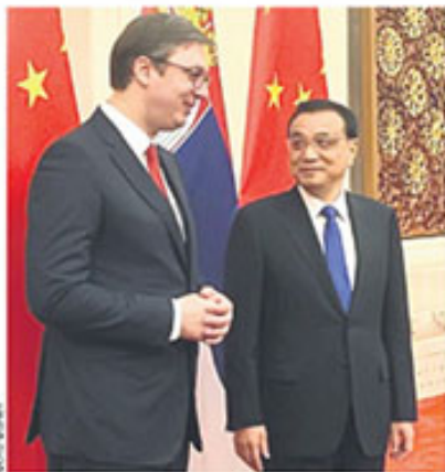
Александар Вучић јуче се сусрео са кинеским премијером Ли Кеђиангом (лево) и председником Си Ђинпингом