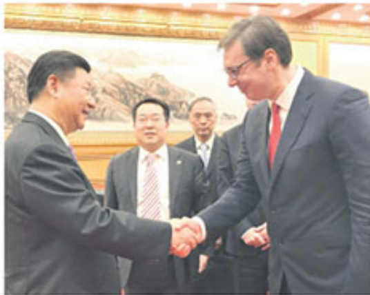
Александар Вучић јуче се сусрео са кинеским председником Си Ђинпингом (лево) и премијером Ли Кеђиангом

Пекинг – Президиј Србије Александар Вучић састао се јуче са председником Си Ђинпингом и премијером Ли Кеђиангом, а у тим разговорима наглашено је међусобно разумевање и уважавање са јасном поруком да је Србија Кини један од најважнијих и најближих стратешких партнера.