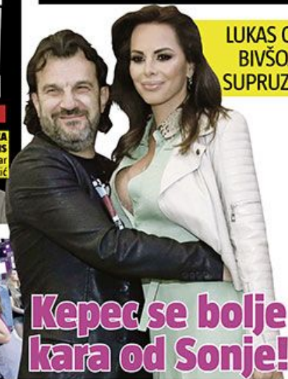
LUKAŠ O BIVŠOJ SUPRUZI

Lekari: Nema Egzita ako se ne vakciniše bar 50 odsto mladih