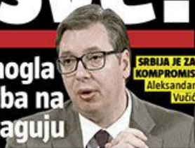
SRBIJA JE ZA KOMPROMIS Aleksandar Vučić

● Neozbiljnost Aljбина Kurtija mogla bi da dovede do eskalacije sukoba na Kosovu, pozivam EU i SAD da reaguju